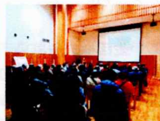
1/21 県民の森フォレストアイ