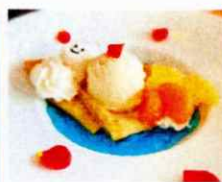
雪だるまフード (市内9か所で展開)