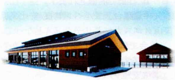
八幡平山頂レストハウス

履歴書を募集期限内に提出（郵送可）して下さい。なお、写真（申込日以前 6 か月以内に撮影した上半身、脱帽、正面のもので本人と確認できるもの）を添付すること。